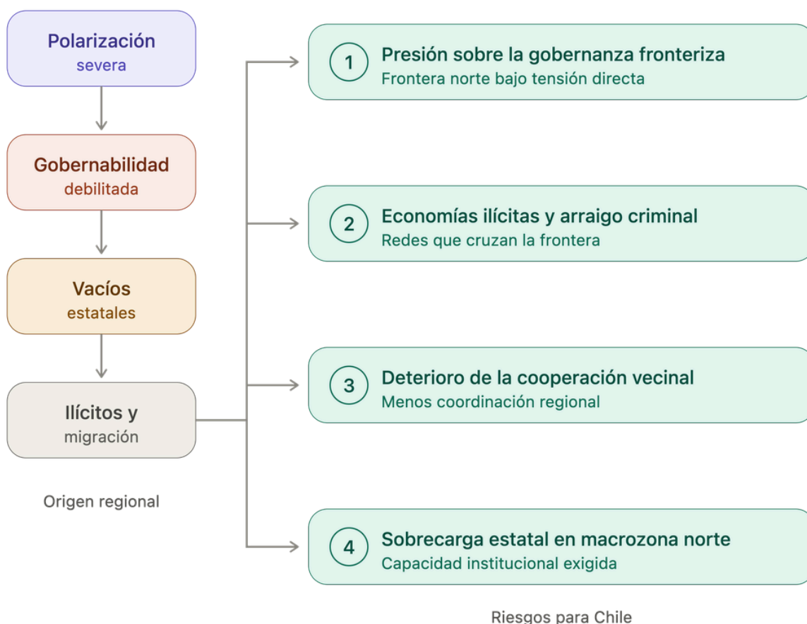
Figura 3. Mecanismo causal y escenarios de riesgo para Chile

y reconducir migración irregular. Los comités binacionales con Perú y acuerdos para la reconducción de ingresos irregulares con Bolivia han dado frutos concretos hasta ahora. El reciente Compromiso de Santiago contra el crimen organizado reafirmó el valor del trabajo conjunto 17 . Pero esa cooperación se sostiene entre gobiernos, y por eso depende de la estabilidad política de la contraparte. Un vecindario polarizado, con administraciones débiles o legitimidad cuestionada, coopera menos justo cuando esa coordinación se vuelve más necesaria.